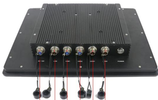
DC 12V LAN USB1 USB2 COM1 COM2