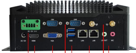
DC IN 12V/24V 2XCOM ANTENAS WIFI